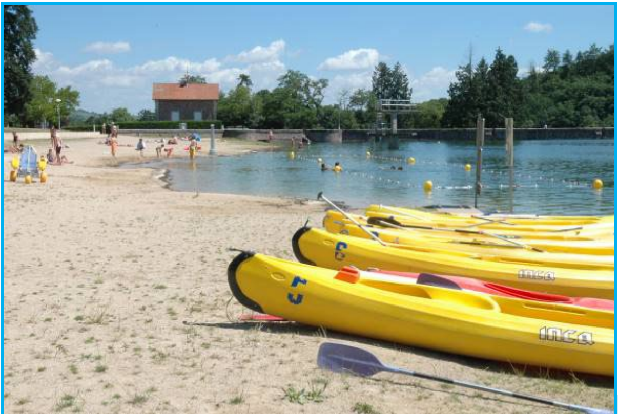
Lac de Pont